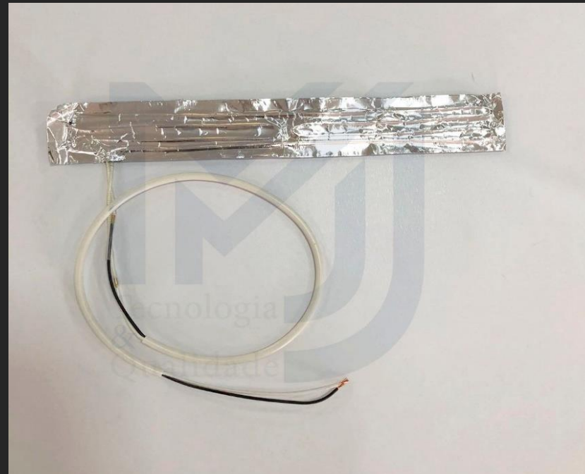
Resistência Calha Brastemp 110v Brd32 Crd32

Este modelo de resistência pode ser fornecido com termorregulagem (termostatos, termofusíveis), cabos de ligação de vários tipos, terminais e ligações específicas.